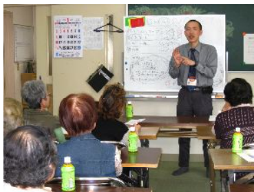
↑ “認知症サポーター養成講座”

高血圧やコレステロール、肩こり等のテーマで、日常の健康管理等で生かしていただける内容について説明させていただきます。