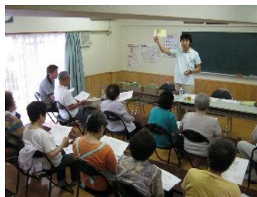
↑ “介護保険制度について”