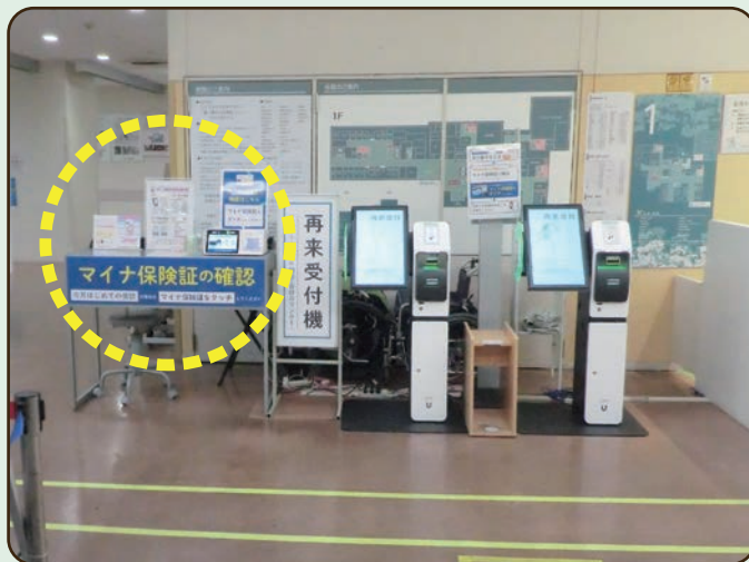
再来受付機の左側にあります