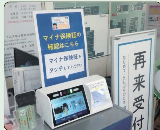
青い看板が目印です